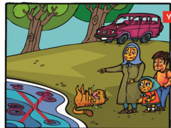
بعد از سیل از آب جاری ننوشیم و به آن نزدیک نشویم، چون ممکن است آلوده باشد.