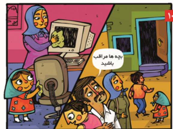
بعد از سیل وسایل خانه را تمیز کنیم تا از آلودگی گل و لای پاک شود. تا زمانی که مسئولین اعلام نکرده اند در نقاط امن بمانیم.