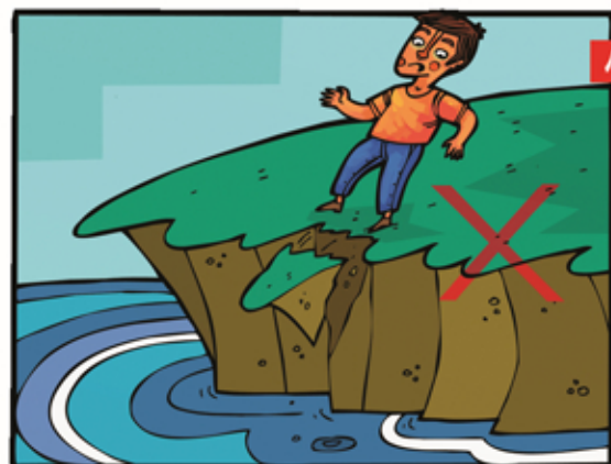
بعد از سیل در لب پرتگاه نایستیم چون ممکن است خاک آن سست شده باشد.