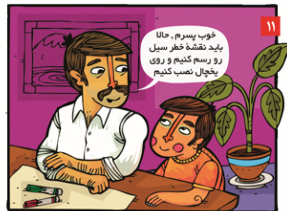
نقشه خطر سیل منطقه یا روستای خود را رسم کنیم. می توانیم از فضای خالی دور کاغذ برای نوشتن اطلاعات ضروری استفاده کنیم، مثل: محتویات کیف اضطراری، زمان مانور خانوار و غیره.